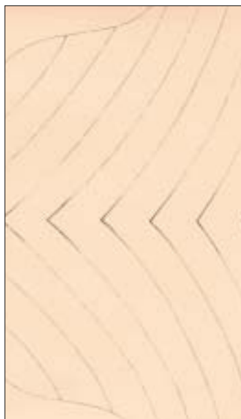
Kresby, inkoust, 24x34 cm.

ANTIQUÉ je mediálním partnerem Severočeské galerie výtvarného umění v Litoměřicích