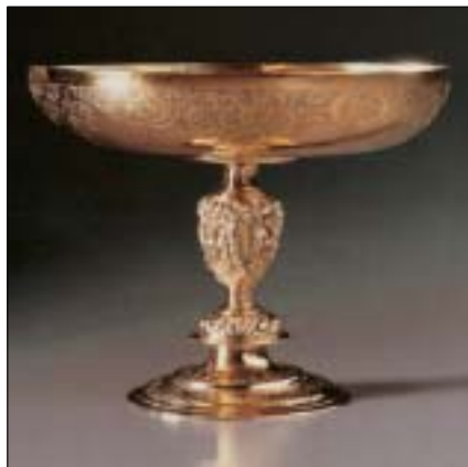
Německý kalich. Stříbro, Augsburg 1550–1575, výška 11 cm.

Celosvětově se průměrné ceny výtvarných děl na aukcích od přelomu roků 1991 a 1992 do 1999 a 2000 zvýšily o 63 %, což znamená průměrný roční nárůst o 6 %. V průběhu těchto let se oproti uvedenému vzoru objevily dvě výjimky. V období od 1992 až 1993 do 1993 až 1994 průměrná cena klesla o 9 %. Na druhou stranu však v období od 1998 až 1999 do 1999 až 2000 se průměrná cena zvýši-